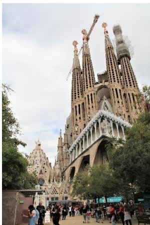
Bazylika Sacrada Familia zdjęcie z 2016

Tak było pięknie, gdy granice dla nas były otwarte. Ponieważ teraz jesteśmy „zamknięci” proponuję podróż do egzotycznej Hiszpanii, mając nadzieję, że Państwo zechcą mi towarzyszyć w tej podróży.