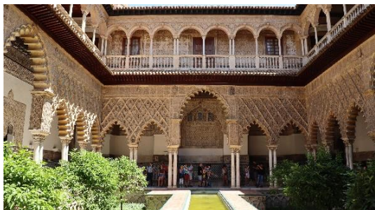
Pałac Chrześcijańskich Królów - Alkazar w Sewilli -

Jak wiadomo Hiszpania, to kraj Miguela de Cervantes'a, tańców flamenco, tanga i corridy oraz mieszanych kultur. Głównie widzieliśmy tu wpływy kultury katolickiej i islamu.