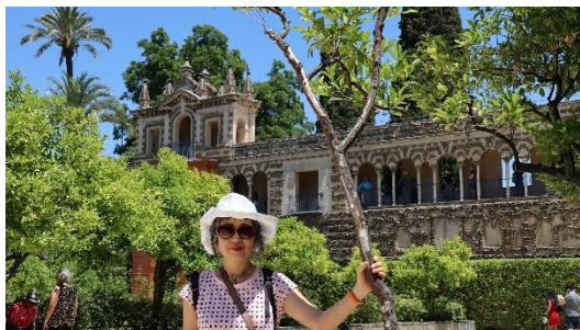
Riho na tle pałacu Alkazar

Katolicyzm w Hiszpanii pojawił się już bardzo wcześnie, bo już w 6 wieku uznano katolicyzm jako religię oficjalną. Obecnie około 70% ludności Hiszpanii wyznaje wiarę katolicką. Ale oprócz tej największej wspólnoty na drugim miejscu plasuje się wspólnota islamska. Nie brak też wspólnot prawosławnych, żydowskich i innych, nawet mormonów, hinduistów i buddystów. Ale te ostatnie nie przekraczają 0,1% ludności i są niewidoczne w porównaniu z żywiołem islamskim. Z rozmowy w restauracji z kelnerką, wynikało, że specjalnych konfliktów między tymi dwoma religiami nie ma, natomiast widoczna jest postępująca laicyzacja życia, lewicowe nastawienie i brak poszanowania dla wartości katolickich, rodzinnych.