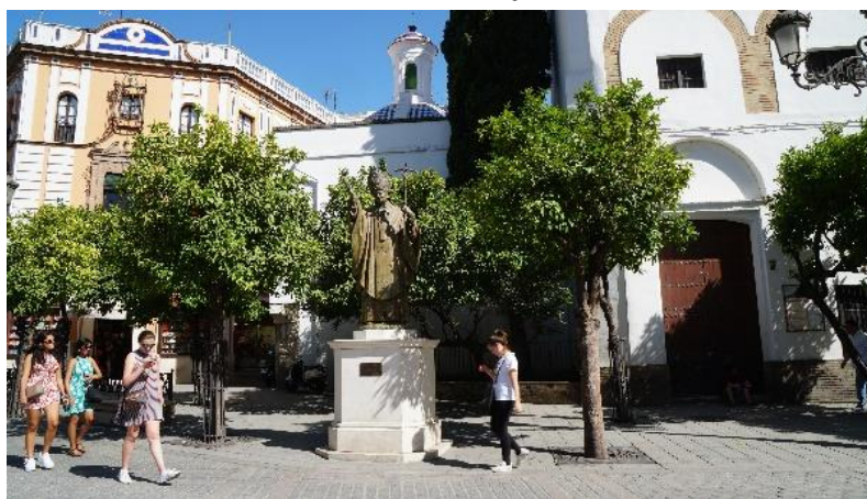
Pomnik Jana Pawła II na Plaza Virgen de los Reyes, Sewilla

Katolicyzm w Hiszpanii pojawił się już bardzo wcześnie, bo już w 6 wieku uznano katolicyzm jako religię oficjalną. Obecnie około 70% ludności Hiszpanii wyznaje wiarę katolicką. Ale oprócz tej największej wspólnoty na drugim miejscu plasuje się wspólnota islamska. Nie brak też wspólnot prawosławnych, żydowskich i innych, nawet mormonów, hinduistów i buddystów. Ale te ostatnie nie przekraczają 0,1% ludności i są niewidoczne w porównaniu z żywiołem islamskim. Z rozmowy w restauracji z kelnerką, wynikało, że specjalnych konfliktów między tymi dwoma religiami nie ma, natomiast widoczna jest postępująca laicyzacja życia, lewicowe nastawienie i brak poszanowania dla wartości katolickich, rodzinnych.